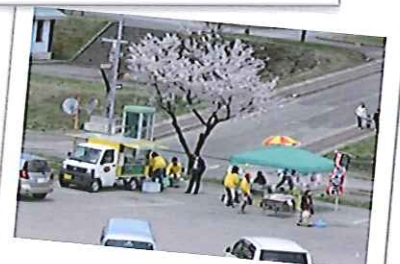
大森公園の桜の下で...