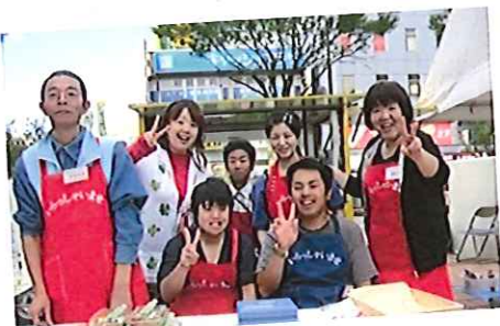
アゴラ広場にてみんなでピース！