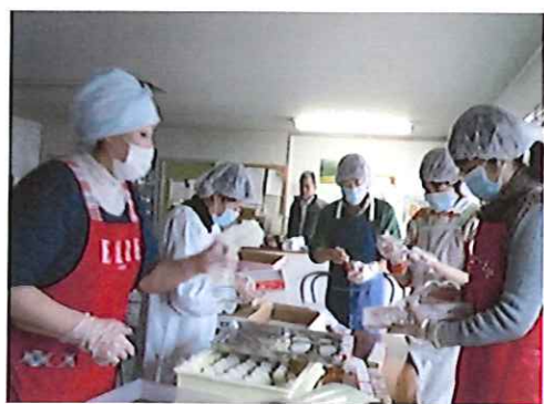
3.11被災地へおにぎりを届けました。