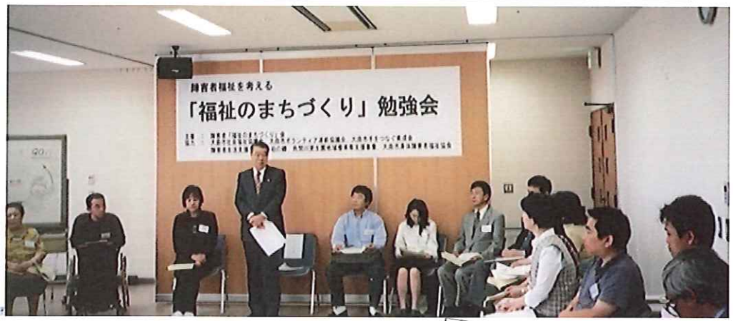
大仙市長より力強いお言葉をいただきました。