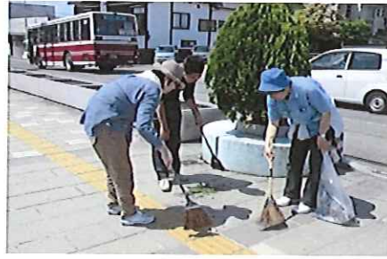
平成20年から6年目。橋の掃除を続けています。