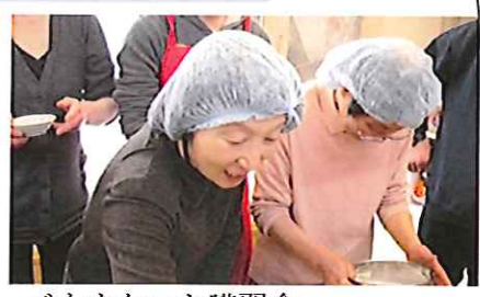
バナナケーキ講習会 おいしいケーキができました。