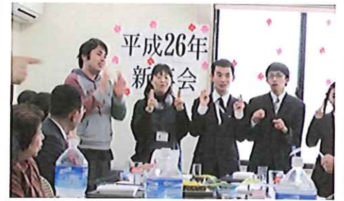
♪～わたしから～あなたへ～♪