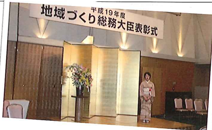
おかげさまでうれしいことがありました。