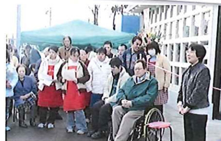
格子が印象的な店舗になりました。