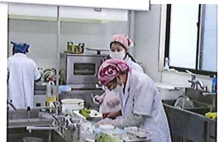
待望の厨房ができました。