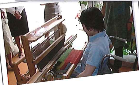
国際ソロプチミスト大曲様からさをり織り機をいただきました。さをり織り作家を目指してがんばっています。