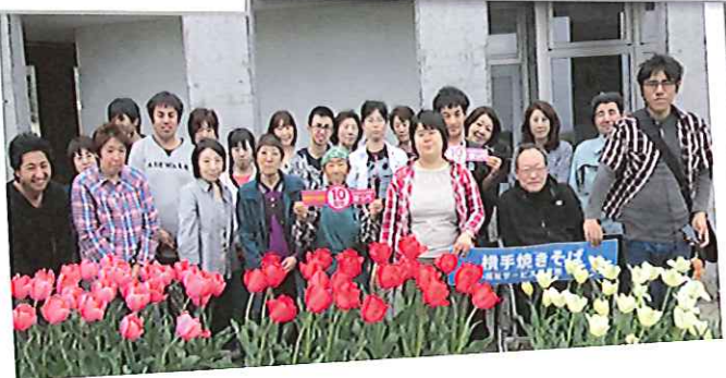
農業科学館でお花見。