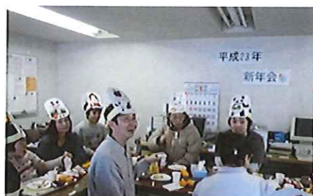
動物ゲームをして楽しみました。