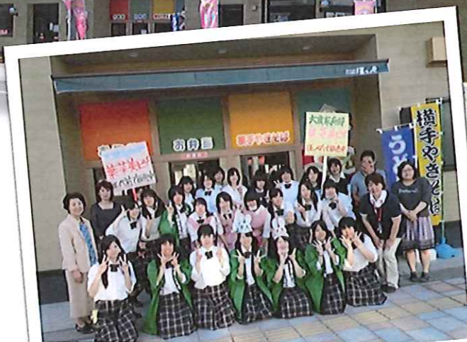
大曲農業高校の家庭部のみなさんと店頭販売。たくさんのお客様が来て下さいました。