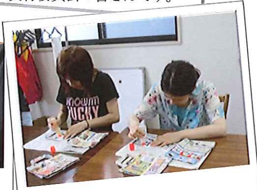
エコバッグを作っています。