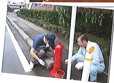
暑い中がんばりました。