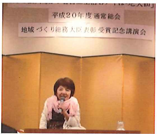
パワフルで優しい遊歩さんです。