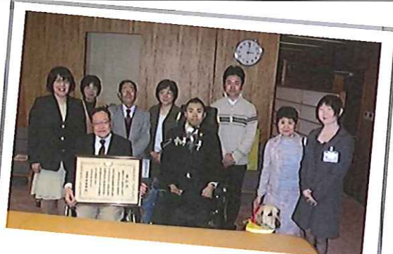
仙北まるごとバリアフリー 実行委員会の皆さんです。