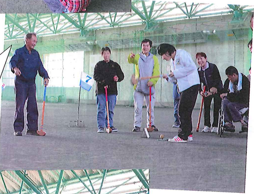
3 組目の代表スナップ です。最終ホールです。 パートナー皆が応援して います。