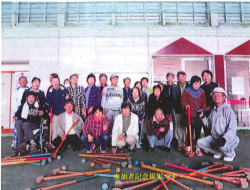
参加者記念撮影です。

「公益社団法人 秋田県手をつなぐ育成会(以下、育成会という)」の承認を得て本人活動支援事業として「第2回やまぼと園親子グランドゴルフ大会」を開催しました。平成26年10月19日(日)湯沢市稲川交流スポーツエリアにて、やまぼと園職員皆様のご協力を得て40名を超える参加者でした。