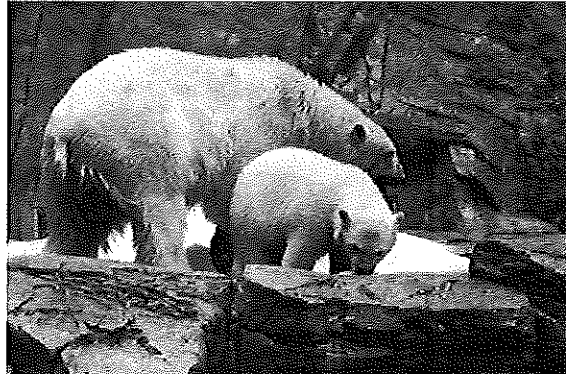
おや こ しろくま親子 くるみ&みるく