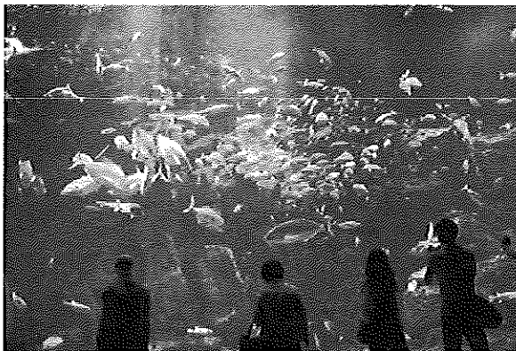
だいすいそう はくりよく 大水槽 迫りあります。

また、世話人を引き受けていただきました、施設職員、秋田県立衛生看護学院生徒の 皆様には改めてお礼を申し上げます。