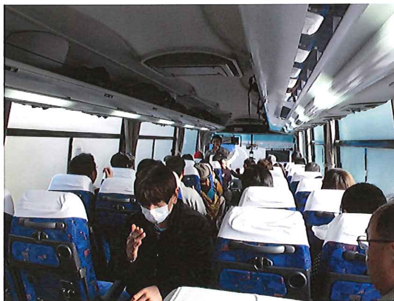
バスの中で今日披露する祝福神の練習